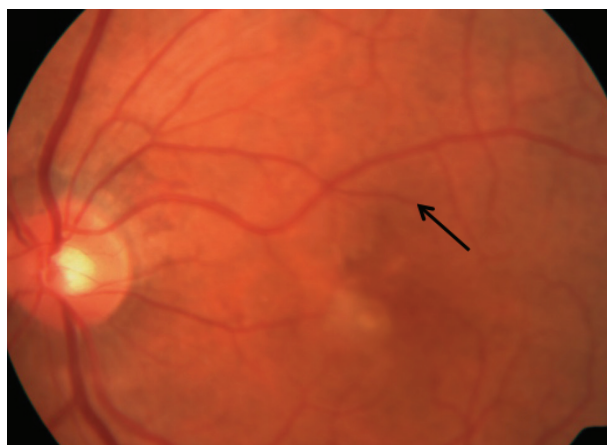
Figura 2 AMD húmeda. Neovascularización coroidea (indicada con la flecha).

En la AMD húmeda, existe una disminución repentina o gradual de la agudeza visual, puntos ciegos en el centro de la visión y distorsión de líneas rectas. El signo distintivo de la AMD húmeda es la neovascularización coroidea ( choroidal neovascularization, CNV ) ( Figura 2 ).